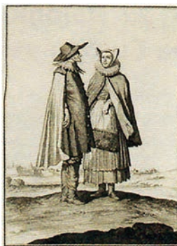
Gravura de vestuário, séc. XVIII.

Descrição da imagem: Imagem composta por dois quadros. O quadro à esquerda, intitulado Gravura de vestuário, século 18 , apresenta uma gravura com um homem e uma mulher, lado a lado, vestindo roupas longas características da sua época. O quadro à direita, intitulado Estátua em porcelana de moça judia nos moldes de gravura de vestuário, século 18 , apresenta uma fotografia de uma estátua de mulher com roupas semelhantes às da mulher da gravura. O rosto da estátua apresenta traços orientais marcantes, que não estão presentes na mulher da gravura.