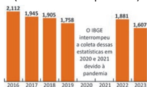
Número de crianças e adolescentes em situação de trabalho infantil (em milhão de pessoas)

GÊNERO – dados de 2023 Meninos: 63,8% Meninas: 36,2%