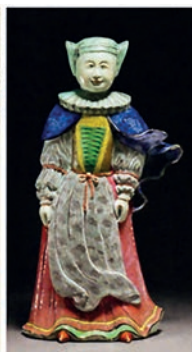
Estátua em porcelana de moça judia nos moldes de gravura de vestuário, séc. XVIII.

Os traços orientais do rosto da estátua indicam a