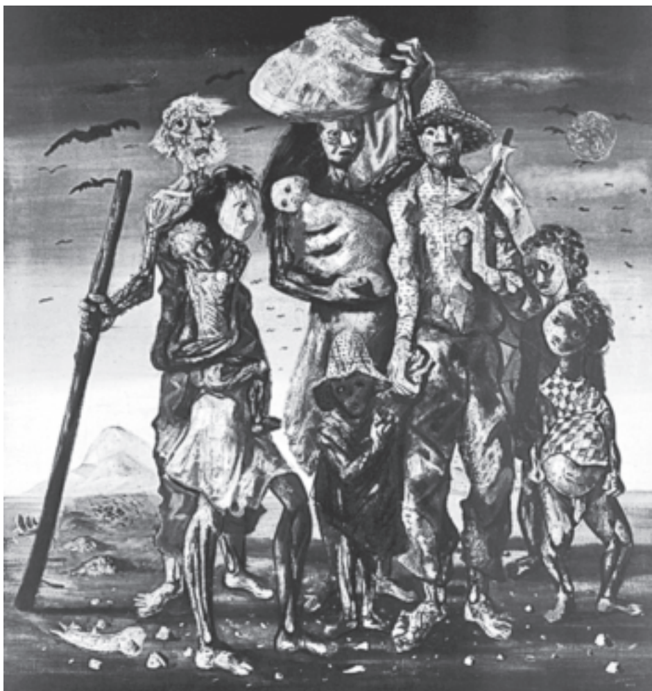
PORTINARI, C. Os retirantes . Óleo sobre tela, 180 x 190 cm. Museu de Arte de São Paulo, Brasil, 1944.

Disponível em: portinari.org.br . Acesso em: 12 fev. 2014.