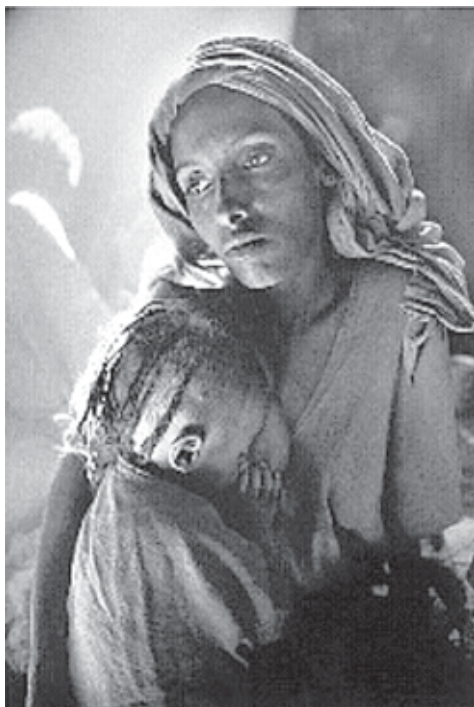
SALGADO, S. Ala de crianças no campo de refugiados de Korem . Fotografia, 1984.

Disponível em: www.girafamania.com.br . Acesso em: 25 abr. 2011.