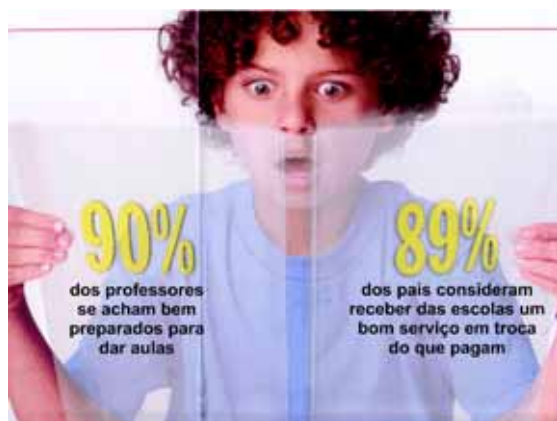
Revista Veja, 20 ago. 2008, p. 72-3.