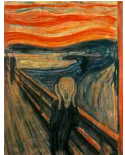
C O grito – Edvard Munch – Museu Munch, Oslo