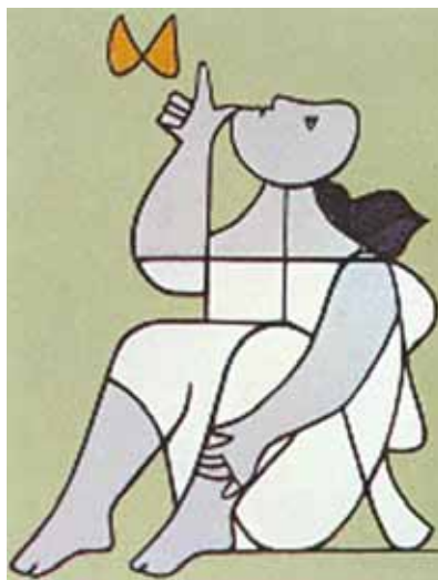
B Figura e borboleta Milton Dacosta