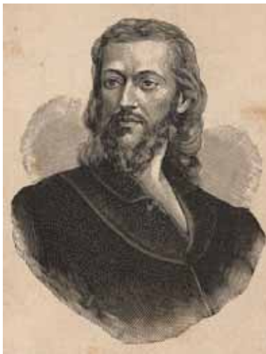
Disponível em: www.morcegolivre.vet.br