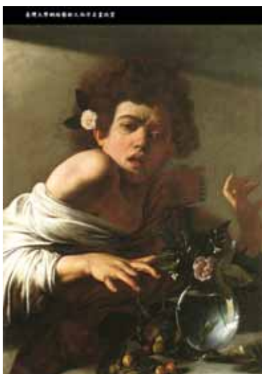
D Menino mordido por um lagarto Michelangelo Merisi (Caravaggio) National Gallery, Londres