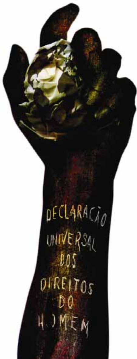
LE MONDE Diplomatique Brasil. Ano 2, n. 7, fev. 2008, p. 31.

O caráter universalizante dos direitos do homem (...) não é da ordem do saber teórico, mas do operatório ou prático: eles são invocados para agir, desde o princípio, em qualquer situação dada.