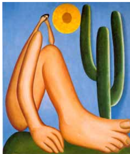
E Abaporu – Tarsila do Amaral