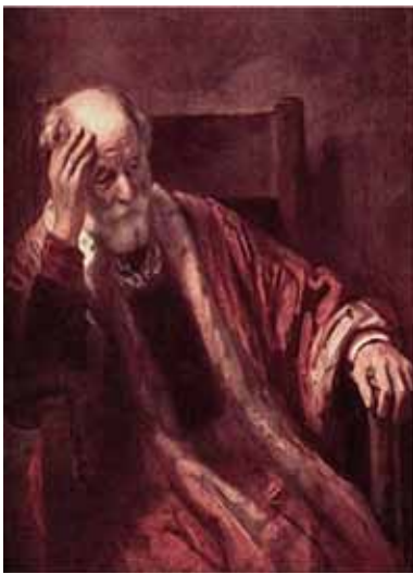
A Homem idoso na poltrona Rembrandt van Rijn – Louvre, Paris.

Das obras a seguir, a que reflete esse enfoque artístico é