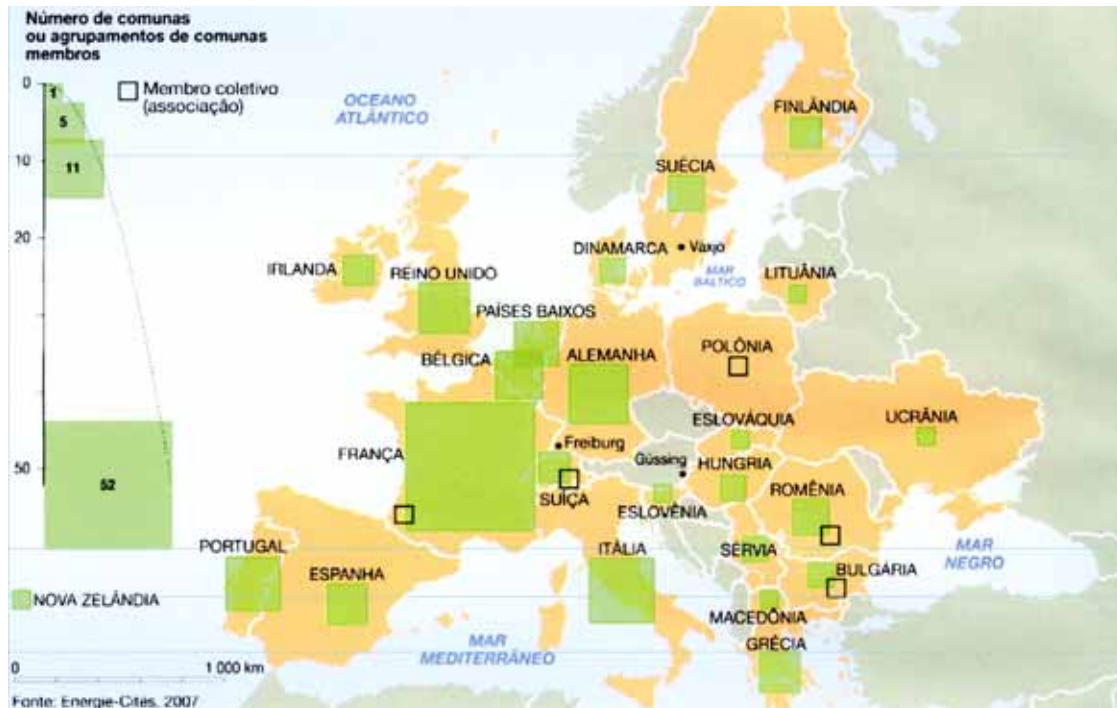
LE MONDE Diplomatique Brasil. Atlas do Meio Ambiente, 2008, p. 82.

No mapa, registra-se uma prática exemplar para que as cidades se tornem sustentáveis de fato, favorecendo as trocas horizontais, ou seja, associando e conectando territórios entre si, evitando desperdícios no uso de energia.