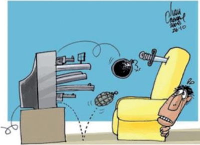
CABRAL, I. Disponível em: < http://www.ivancabral.com >. Acesso em: 18 jul. 2012.

DAHLBERG, L. L.; KRUG, E. G. Violência : um problema global de saúde pública. Disponível em: < http://www.scielo.br >. Acesso em: 18 jul. 2012 (adaptado).