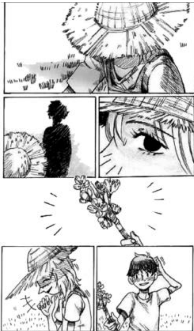
JU LOYOLA. The promise of happiness.

LOYOLA, J. Disponível em: http://ladyscomics.com.br . Acesso em: 8 dez. 2018 (adaptado).