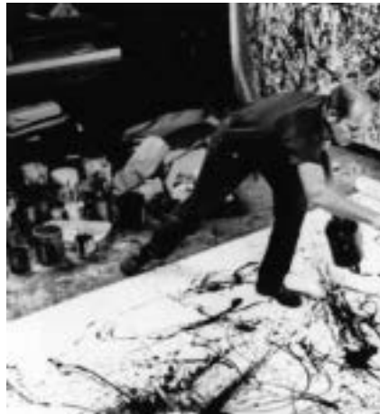
Fotografia de Jackson Pollock pintando em seu ateliê, realizada por Hans Namuth em 1951.