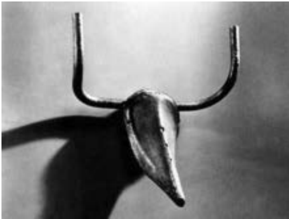
PICASSO, P. Cabeça de touro . Bronze, 33,5 cm x 43,5 cm x 19 cm. Musée Picasso, Paris. França, 1945.

JANSON, H. W. Iniciação à história da arte . São Paulo: Martins Fontes, 1988.