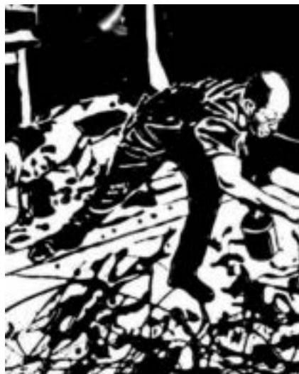
MUNIZ, V. Action Photo (segundo Hans Namuth em Pictures in Chocolate ). Impressão fotográfica, 152,4 cm x 121,92 cm, The Museum of Modern Art, Nova Iorque, 1977.

NEVES, A. História da arte 4 . Vitória: Ufes – Nead, 2011.