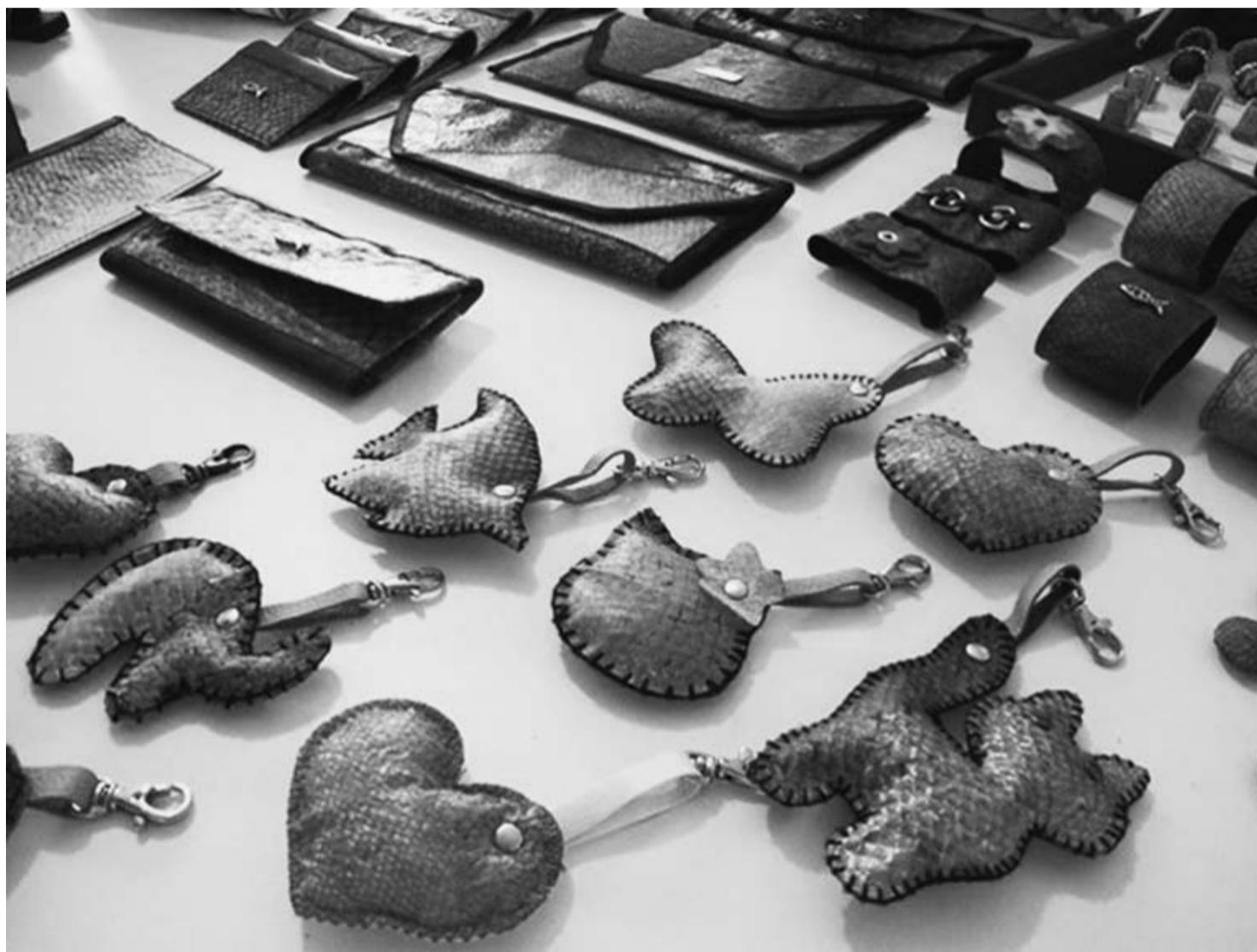
ROSSI, M. Produtos feitos com o couro de peixe em Guarujá, SP. Disponível em: http://g1.globo.com . Acesso em: 4 set. 2014.

Qualquer tipo de pele de peixe vira artesanato na mão de um biólogo do litoral de São Paulo. Ele criou um método mais natural de transformar a fina camada de pele em couro de peixe. Assim, ele retira do meio ambiente um material que seria jogado no lixo e inventa novas peças como bolsas, chaveiros e anéis, como os objetos apresentados na imagem.