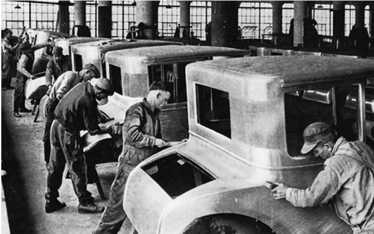
Figura 1 – Fabricação de automóveis em 1927

Disponível em: www.thedailybeast.com . Acesso em: 8 dez. 2012.