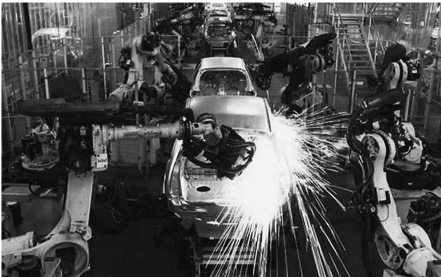
Figura 2 – Fabricação de automóveis em 2012

Disponível em: http://revistacrescer.globo.com . Acesso em: 7 ago. 2014.