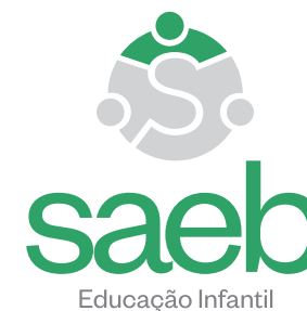
VERSÃO SECUNDÁRIA (uso específico)