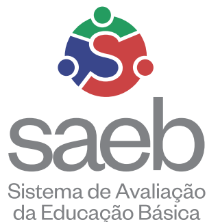
VERSÃO SECUNDÁRIA (vertical)