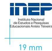
REDUÇÃO MÁXIMA Mídia Impressa