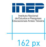
REDUÇÃO MÁXIMA Mídia Eletrônica