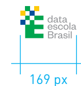
REDUÇÃO MÁXIMA Mídia Eletrônica